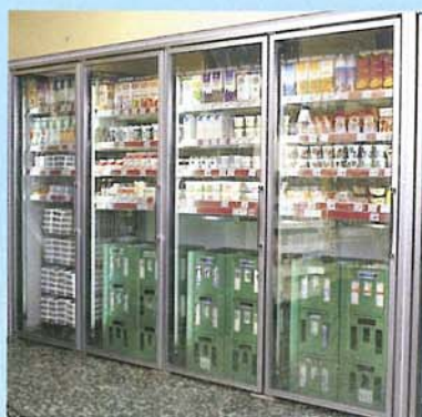
Anthony glasdøre model Roll-in (model 103)