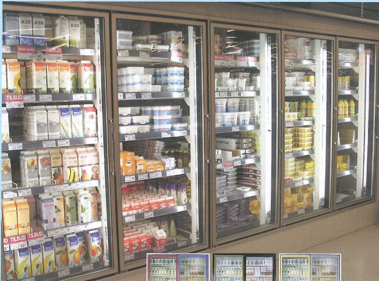
Sølv-anodiseret dørramme (model 101) Døre i mange farver (model 2100)

model 101/Roll-in 103 og model 2100 /Roll-in 2103