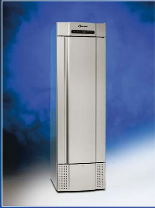
MIDI 425 CX