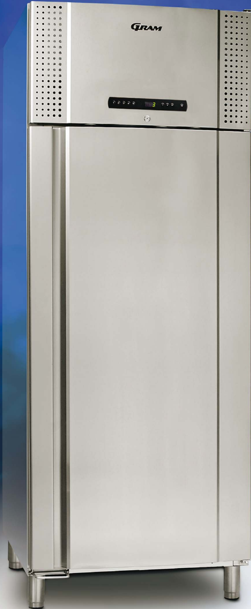
TWIN 660 CX