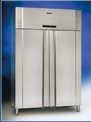
PLUS 1400 CX