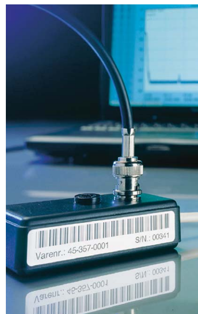
Gram Data Logger